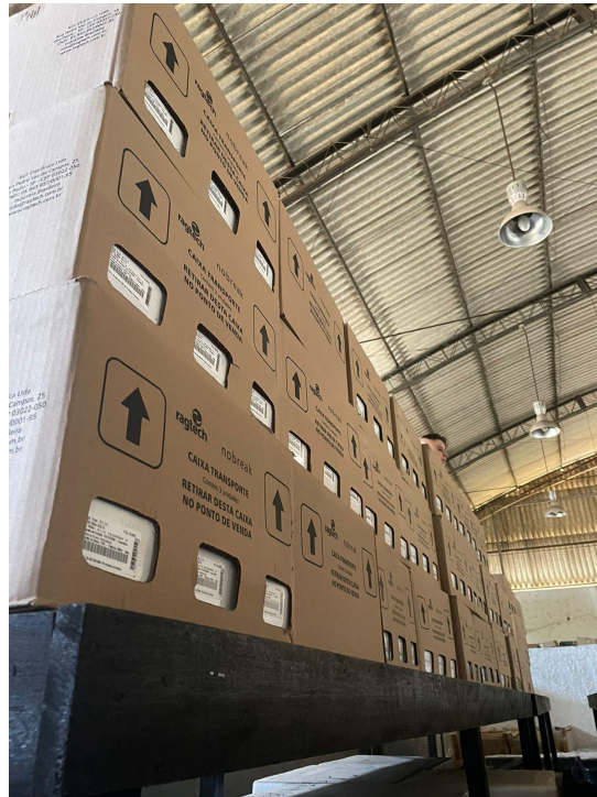
215 NOBRAKS ARMAZENADOS NO ALMOXARIFADO CENTRAL