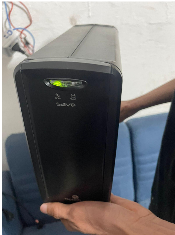
NOBREAK FUNCIONANDO EM REDE