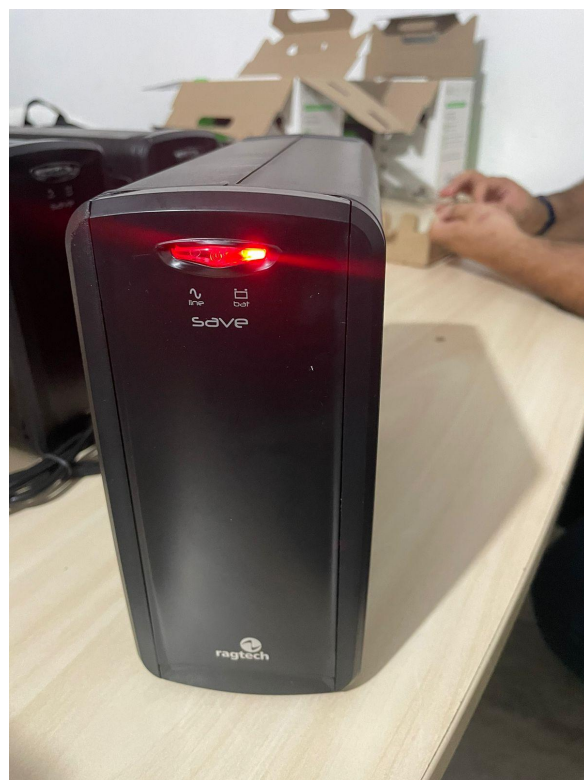
NOBREAK FUNCIONANDO SEM REDE